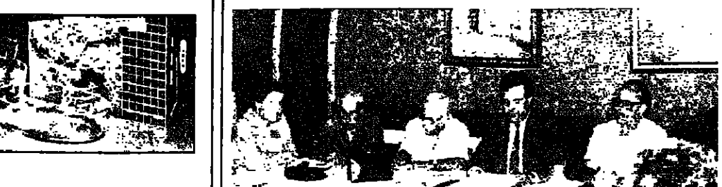
اجتماع المجلس التلطي

اللقوق - الانوار: عقد المجلس التلطي في بلاد جبيل اجتماعين متتاليين الاول لهيئة الادارية والثاني لهيئة العامة. وذلك في منتجج - اللقلاذ. حيث جرى البحث في شؤون ثقافية عدة وكان اهمها ان اتخذ قرار بتمتعة اصدار مجلة المجلس الثقافية. ايجابية الورد. وسامعة الاعضاء والقراء